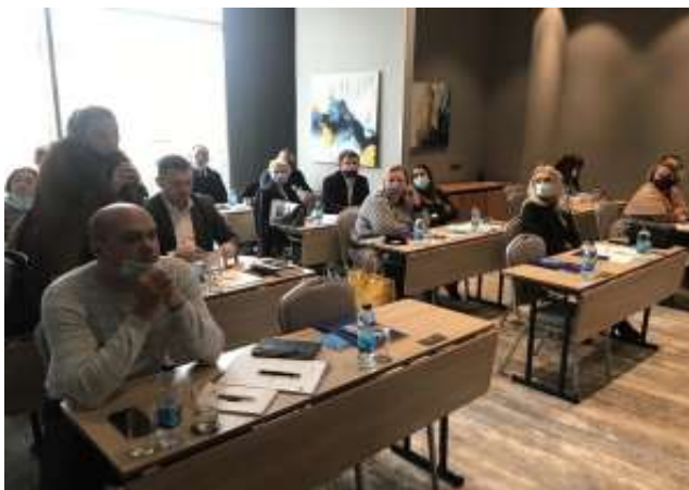
Тренинг тренера изборних комисија Бања Лука, 22 - 24.01.2022. године