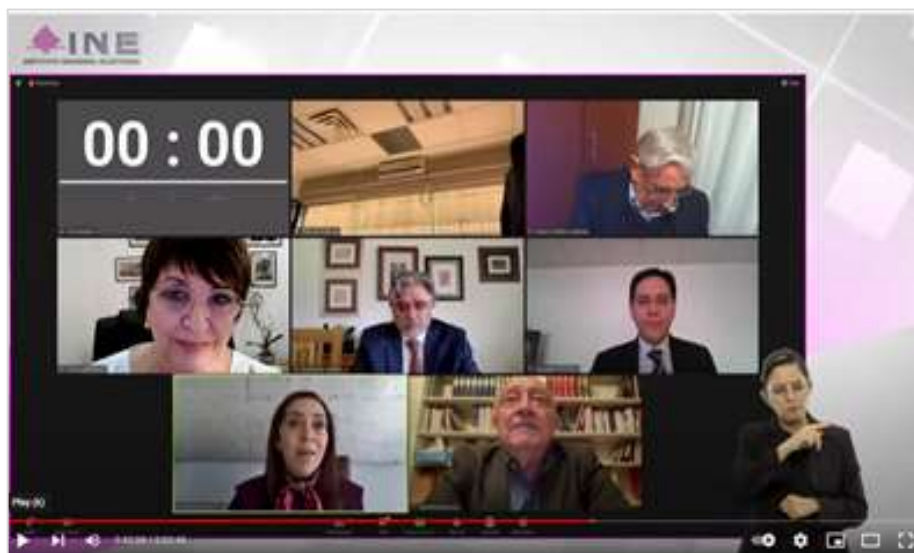
Глобални Форум за демократију „Улога изборних тијела у демократском управљању“