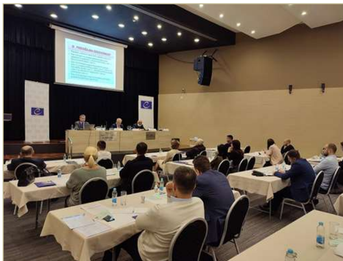
Тренинг тренера изборних комисија Теслић, 18-20.12.2021.године