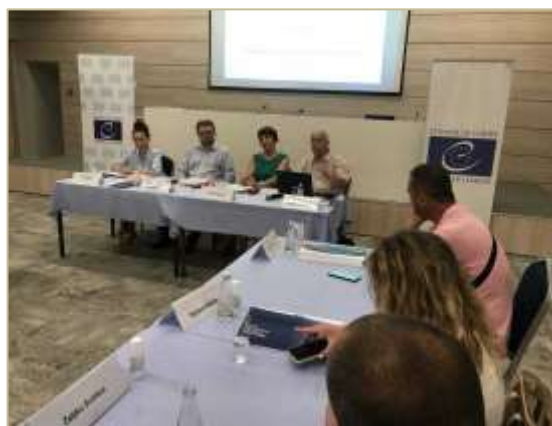
Семинар “Јачање капацитета медија за професионални мониторинг и извјештавање о изборном процесу” Неум, 08-11. 07. 2021. године