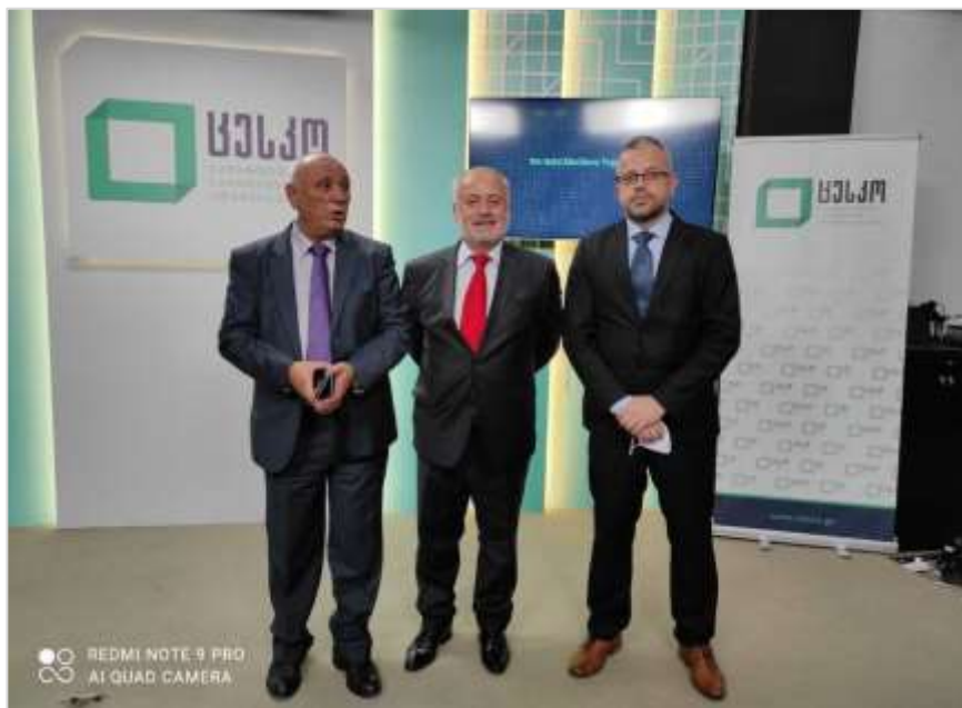
Делегација ЦИК БиХ у посјети Грузији

одржавања избора. Била је то прилика да се размијене и стекну нова искуства у провођењу избора.