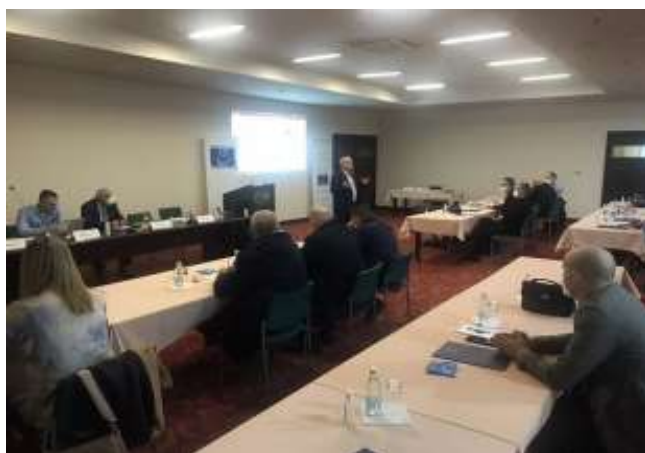
Тренинг тренера изборних комисија, Зеница, 19- 21.02.2022. године