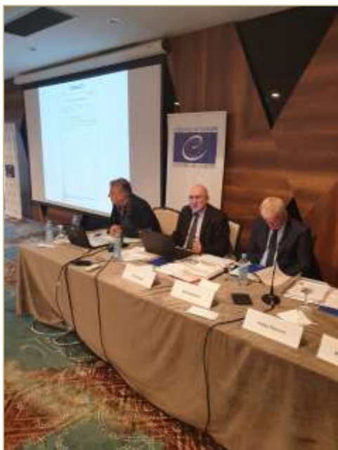
Тренинг тренера изборних комисија Сарајево, 11-13. 11. 2021. године