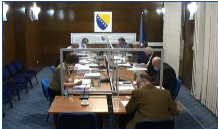
Јутјуб скриншот (Youtube screenshot)