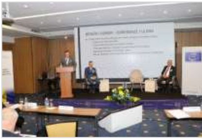
Предсједници ГИК Градишка, ГИК Зеница и ОИК Бугојно