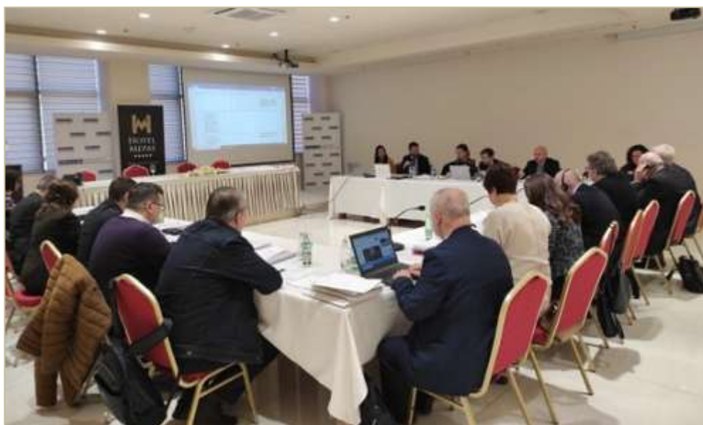
Радионица о подзаконским актима ЦИК БиХ и препорукама ОДИХР-а Мостар, 16-17. 12.2021. године