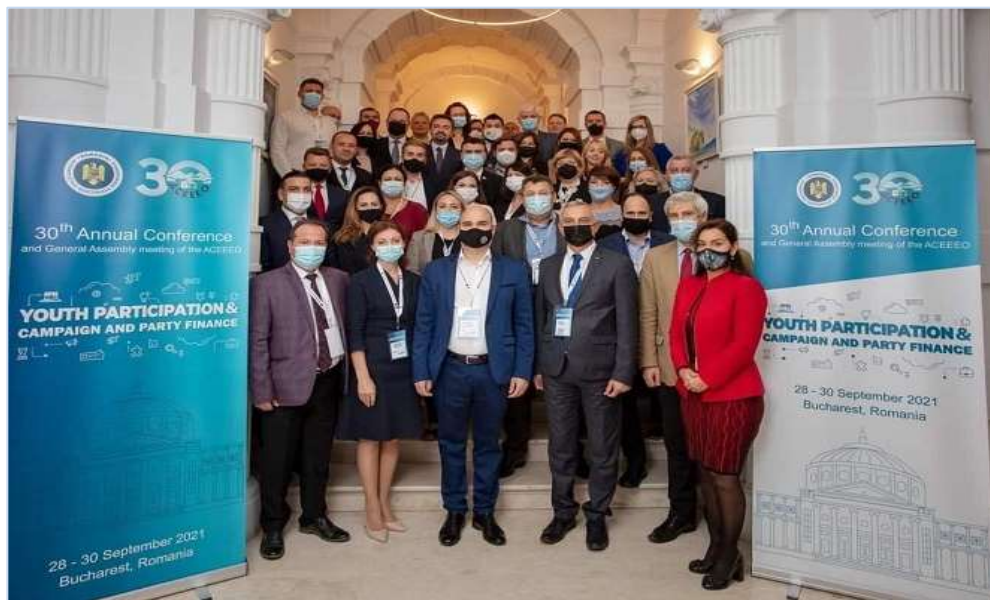
Учесници 30. годишње Конференције АЦЕЕЕО-а - Букурешт, новембар 2021. године