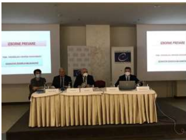
Тренинг тренера изборних комисија, Мостар, 12- 14.02.2022. године