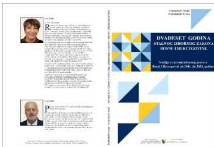
Публикација “20 година сталног Изборног закона Босне и Херцеговине” - Студија о развоју изборног права у Босни и Херцеговини од 2001. до 2021. године