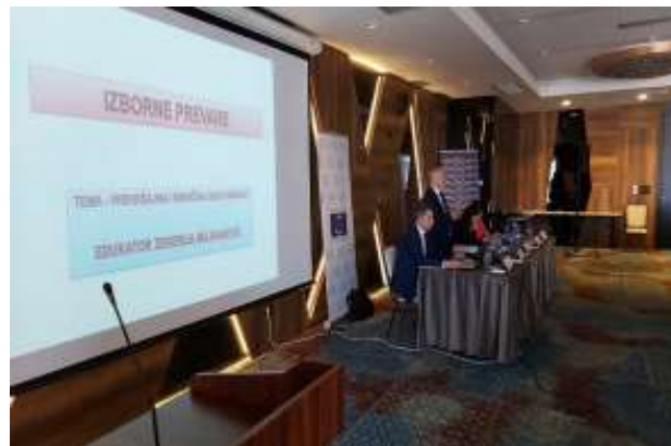
Тренинг тренера изборних комисија за новоименоване чланове општинских/градских изборних комисија, Сарајево, 25-27.03.2022. године