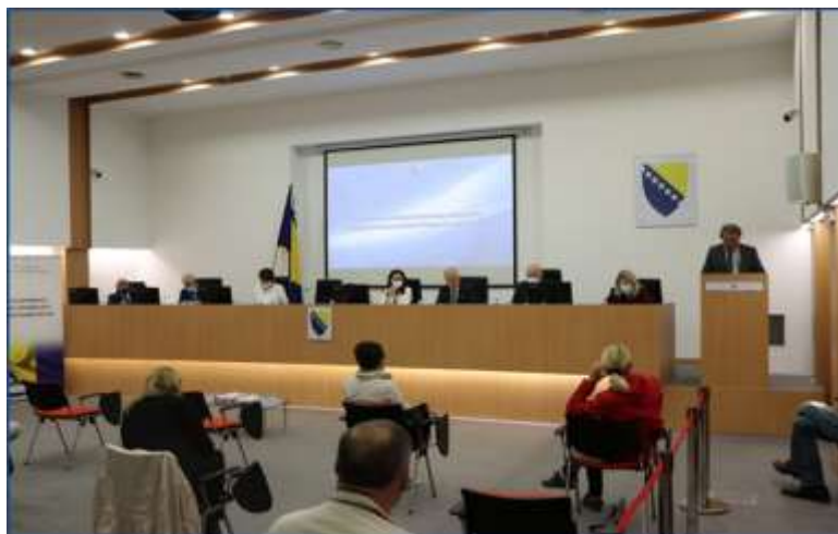
Конференција за штампу ЦИК БиХ - Сарајево, 08.06.2021. године