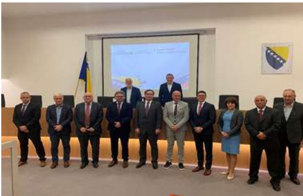
Представници Централне изборне комисија БиХ и Државне изборне комисије Републике Словеније