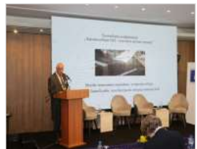
Јован Калаба, члан ЦИК БиХ