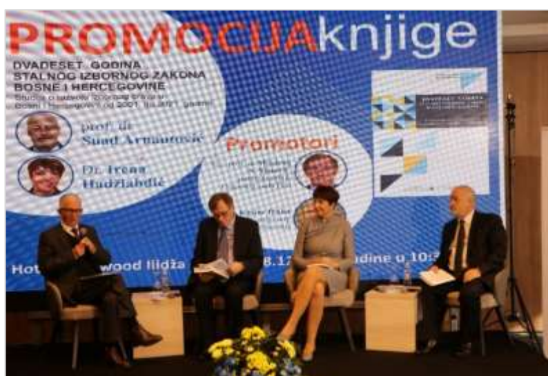
Презентација публикације “20 година сталног Изборног закона Босне и Херцеговине” Студија о развоју изборног права у Босни и Херцеговини од 2001. до 2021. године

460. Закључци конференције ће бити кориштени за формулисање препорука за унапређење изборног процеса које ће Централна изборна комисија БиХ у свом Извјештају о провођењу закона и надлежности Централне изборне комисије Босне и Херцеговине доставити Парламентарној скупштини БиХ.