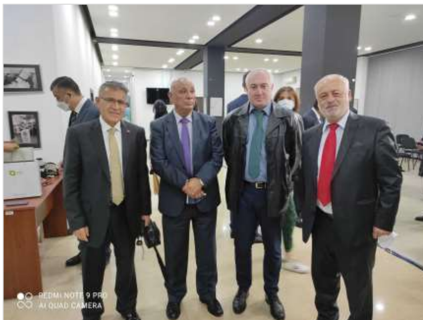
Сусрет са представницима Врховног изборног вијећа Републике Турске