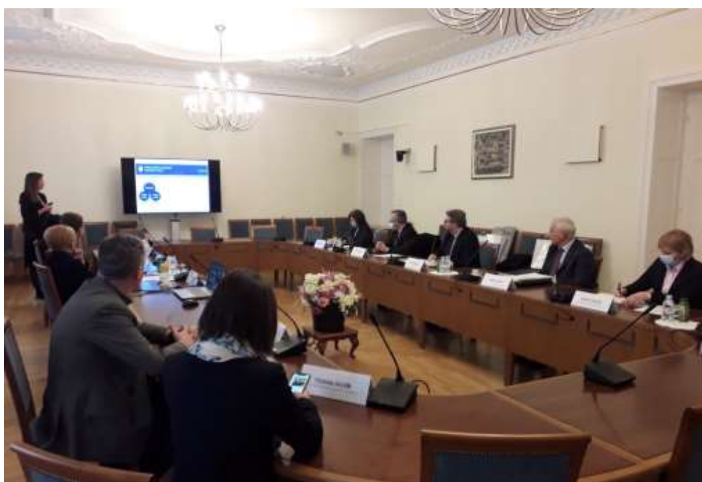
Посјета Државном изборном повјеренству Републике Хрватске

Током програма посјете која се одвијала у сједишту Сабора Републике Хрватске и сједишту ДИП Републике Хрватске, представници ДИП Републике Хрватске су упознали делегацију Централне изборне комисије БиХ са њиховим надлежностима, начином рада, законским оквиром, организацијском структуром, као и са изазовима са којим се сусрећу у свом раду из области надзора финансирања политичких активности и надзором финансирања политичке кампање у Републици Хрватској.